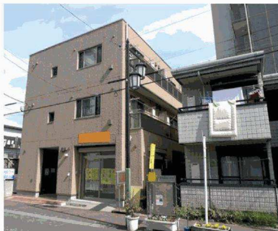
● 現地案内図 ●